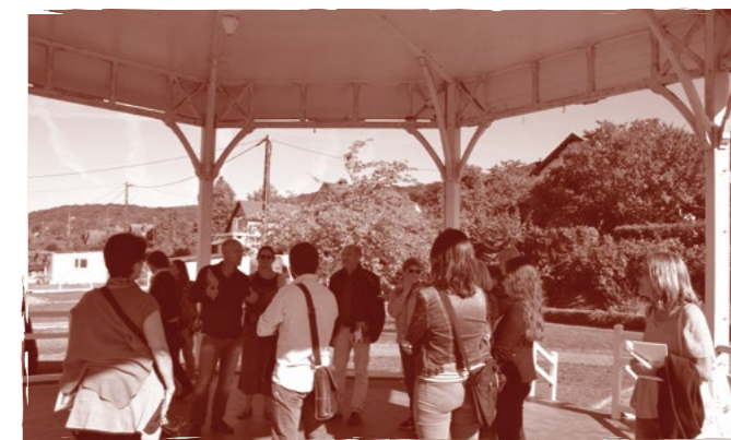
Voyage d'étude à la découverte des cités-jardins de la Métropole de Rouen, 2018