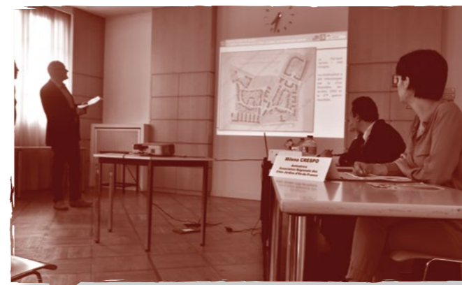
« Comment rénover les cités-jardins, un patrimoine habité ? », 2018

■ RÉALISATION D'UN INVENTAIRE des cités-jardins à l'échelle régionale, nationale et internationale : diagnostic, expertise, ouvrage de référence.