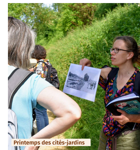
Printemps des cités-jardins

Chaque année, durant trois week-ends, les cités-jardins adhérentes et partenaires ouvrent leurs portes pour le Printemps des cités-jardins. Balades, randonnées, conférences sont au cœur de cet événement.