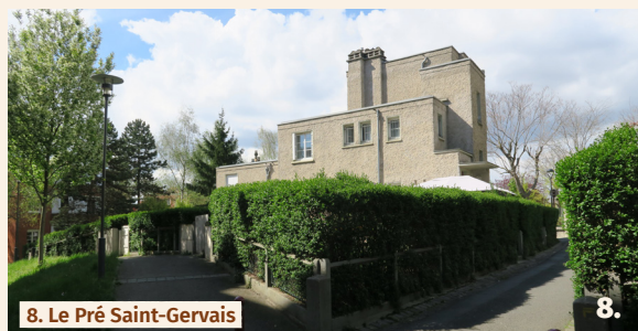
8. Le Pré Saint-Gervais