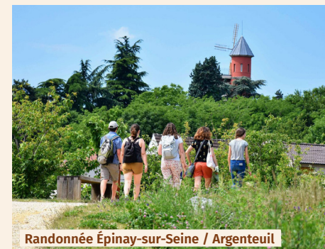
Randonnée Épinay-sur-Seine / Argenteuil