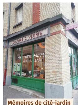
Mémoires de cité-jardin

Siège social de l'Association, le local « Mémoires de cité-jardin » constitue un lieu de visites, de rencontres, d'ateliers, d'expositions et d'animations sur les cités-jardins d'Île-de-France et plus particulièrement celle de Stains. À Suresnes, le Musée d'histoire urbaine et sociale (MUS) constitue le musée et le centre de documentation de référence sur le sujet.