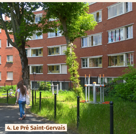
4. Le Pré Saint-Gervais