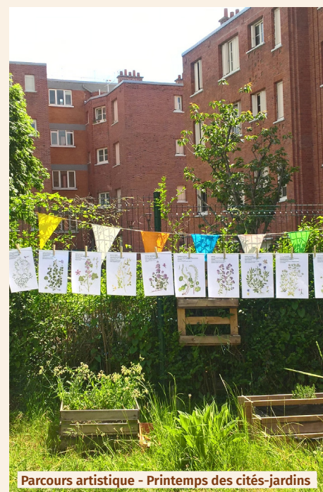
Parcours artistique - Printemps des cités-jardins

Des villes, des bailleurs de logements sociaux, des offices de tourisme, des amicales de locataires, des instituts d'enseignement supérieur, des partenaires étrangers mais aussi des habitants et des passionnés, tous acteurs de ce patrimoine.