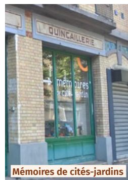
Mémoires de cités-jardins

Siège social de l'Association, le local « Mémoires de cité-jardin » constitue un lieu de visites, de rencontres, d'ateliers, d'expositions et d'animations sur des cités-jardins d'Île-de-France et plus particulièrement celle de Stains. À Suresnes, le Musée d'histoire urbaine et sociale (MUS) constitue le musée et le centre de documentation de référence sur le sujet.