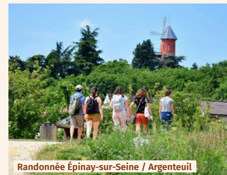
Randonnée Épinay-sur-Seine / Argenteuil