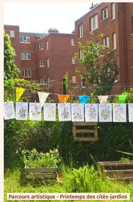
Parcours artistique - Printemps des cités-jardins

Des villes, des bailleurs, des offices de tourisme, des amicales de locataire, des instituts d'enseignement supérieur, des partenaires étrangers mais aussi des habitants et des passionnés, tous acteurs de ce patrimoine.