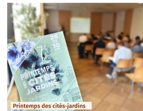
Printemps des cités-jardins

Chaque année, durant trois weekends, les cités-jardins adhérentes et partenaires ouvrent leurs portes pour le Printemps des cités-jardins. Balades, randonnées, conférences sont au cœur de cet événement.